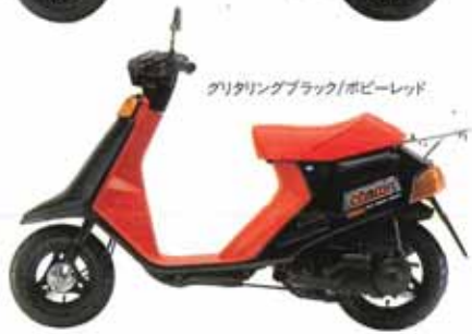
グリタリングブラック/ホビーレッド