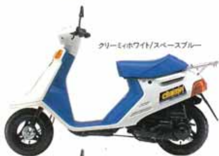
クリーミーホワイト/スペースブルー