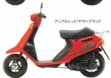
アップルレッド/ヤマハブラック