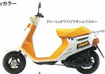
クリーミーホワイト/マキシムイエロー