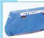
ボディカバー 標準現金価格 ¥4,000