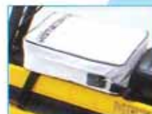
タンクバック 標準現金価格 ¥4,200