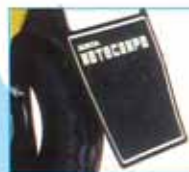
リアマッドガード 標準現金価格 ¥1,200