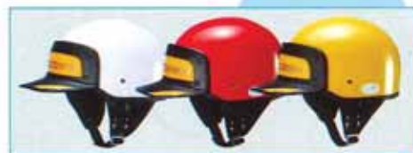
ヘルメット 標準現金価格 ¥8,400