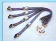
タイダウンKIT 標準現金価格 ¥8,500 (専用ヘルム)